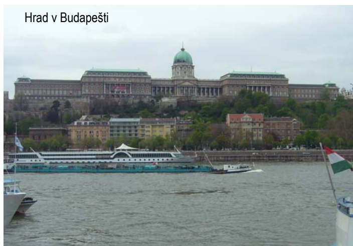
Hrad v Budapešti

O víkendech jsme si udělaly několik výletů mimo Nyíregyházu – do Debrecenu, Tokaje a samozřejmě do Budapešti, což je velmi pěkné město s mnoha historickými památkami a krásnou architekturou.