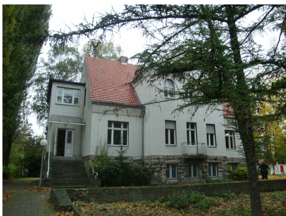
Zařízení pro delikventní mládež