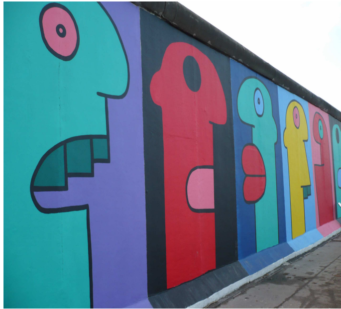
East side Gallery (Berlínská zed')