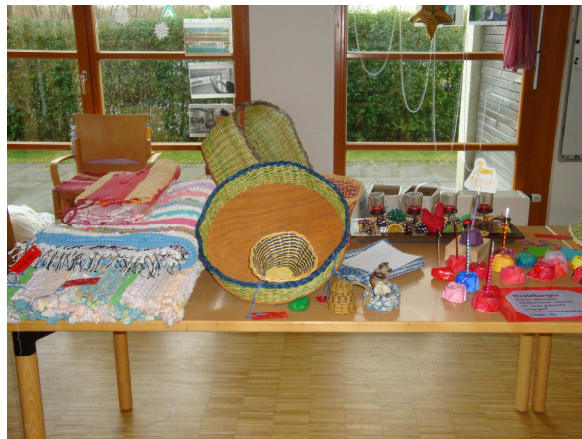
Výrobky od lidí s postižením