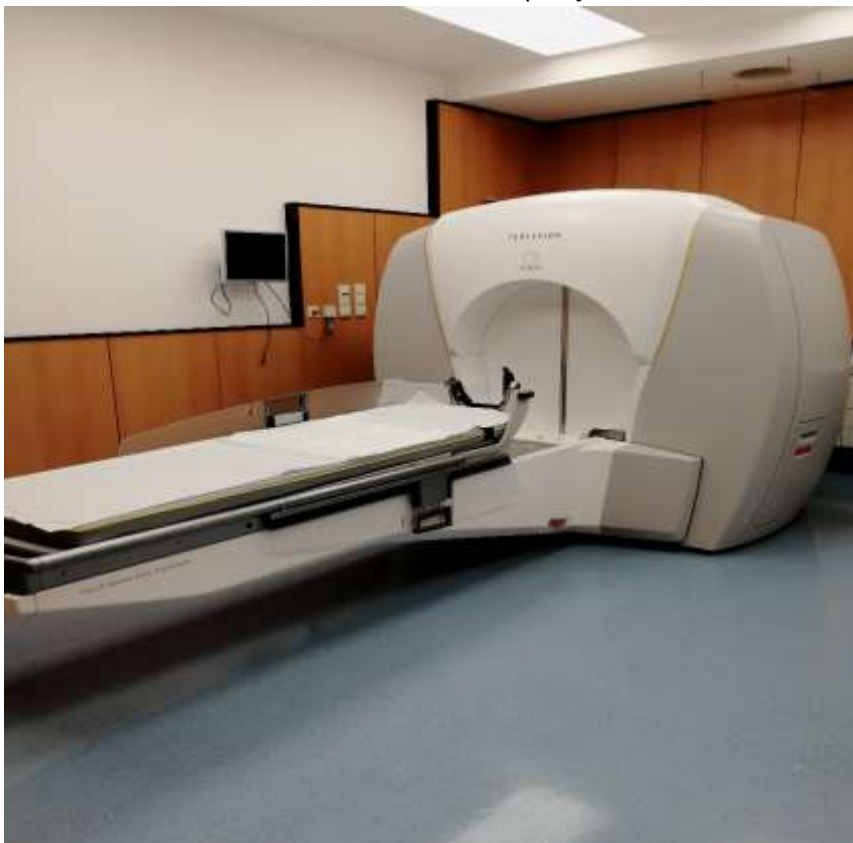
Obrázek 4: Lekselův Gamma nůž

Samotná praxe se konala každý den od 7:00 do 15:00 a bylo potřeba to dodržet na minutu přesně. (Opravdu slovo pünktlich pochází asi z této nemocnice.) Největší odměnou pro mě bylo konečně vidět Lekselův Gamma nůž. Ukážu Vám alespoň jeho obrázek.