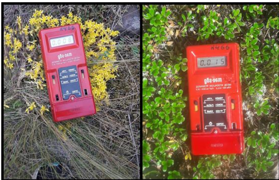
Měření úrovně radiace na ostrově Valaam.

Z Petrohradu jsme se přesunuly do přístavu, kde na nás čekala loď a přibližně za dvě hodiny jsme dorazily na ostrov Valaam. Jedná se o souostroví nacházející se na Ladožském jezeře, hlavní a zároveň největší ostrov je Valaam. Jedná se o překrásné místo plné relativně nedotčené přírody, která je narušena pouze přítomností řady ruských turistů, kteří sem jezdí kvůli návštěvě místního kláštera a kostelů. Na ostrově se nachází stanice RSHU, která se skládá z kuchyně s jídelnou, hlavní budovy s učebnou a laboratoří, chatky pro ubytování a studentské meteostanice. Byly jsme ubytovány v chatce s dalšími třemi ruskými studentkami, nicméně řada studentů spala ve stanech. Praxi jsme absolvovaly společně se studenty ekologie, meteorologie a hydrologie. Chodily jsme na exkurze, kde jsme sbíraly vzorky vody z místních jezer a následně je analyzovaly v laboratoři. Hlavní náplní naší praxe bylo měření úrovně radiace pomocí dozimetru na různých místech na ostrově Valaam. Kromě zmíněných činností, jsme se účastnily přednášek o biodiverzitě fauny i flóry ostrovu Valaam či návštěvy tamního kláštera s místními studenty.