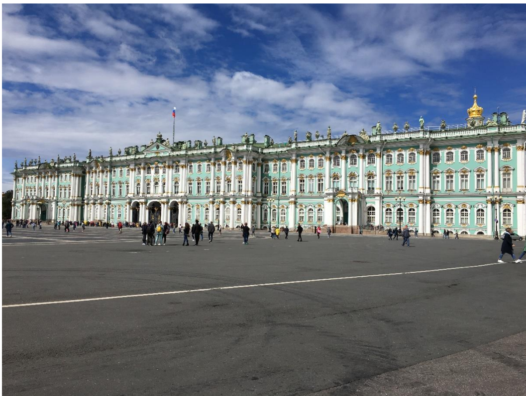
Ermitáž (Budova Zimního paláce)