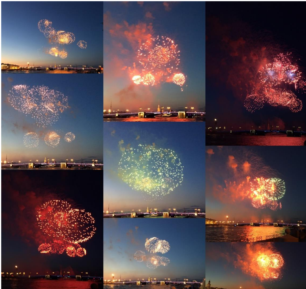
Ohňostroj během Navy day