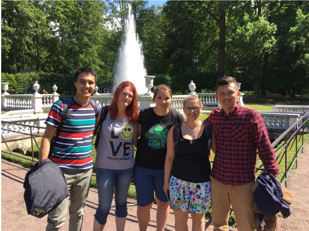
Návštěva Petrodvorce s místními studenty.