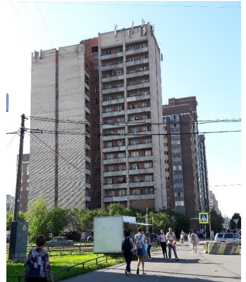
Ubytování v Petrohradě.

Po příletu na letiště na nás čekal ruský vyučující (Ernest), který nás odvezl do našeho ubytování ve studentském hostelu. Úroveň ubytování byla dostačující, měly jsme pro sebe dva pokoje, vlastní kuchyňku (vybavenou lednicí, varnou konvicí i sporákem, základní nádobí) i vlastní sociální zařízení. Velkou výhodou bylo, že jsme za toto ubytování nemusely platit. V době našeho pobytu zde probíhala rekonstrukce výtahu i obytných prostor. Je nutné zdůraznit, že voda zde (ani na jiných místech v Rusku) není pitná. Internet je zde k dispozici, ale většinou nefunguje.