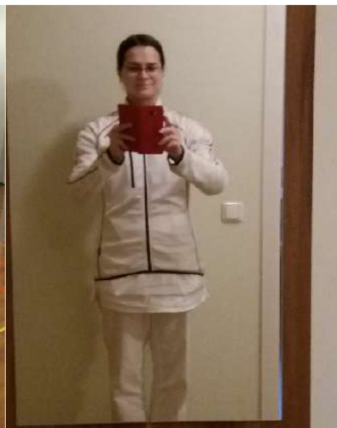
1. den před nástupem na praxi