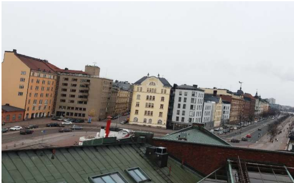
Estonsko - Tartu