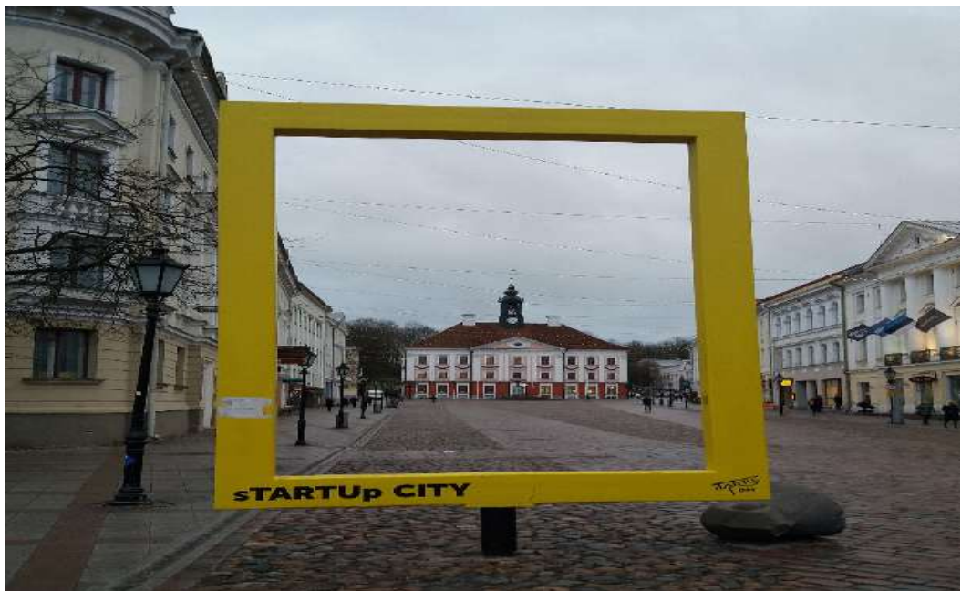
Estonsko – Tallinn