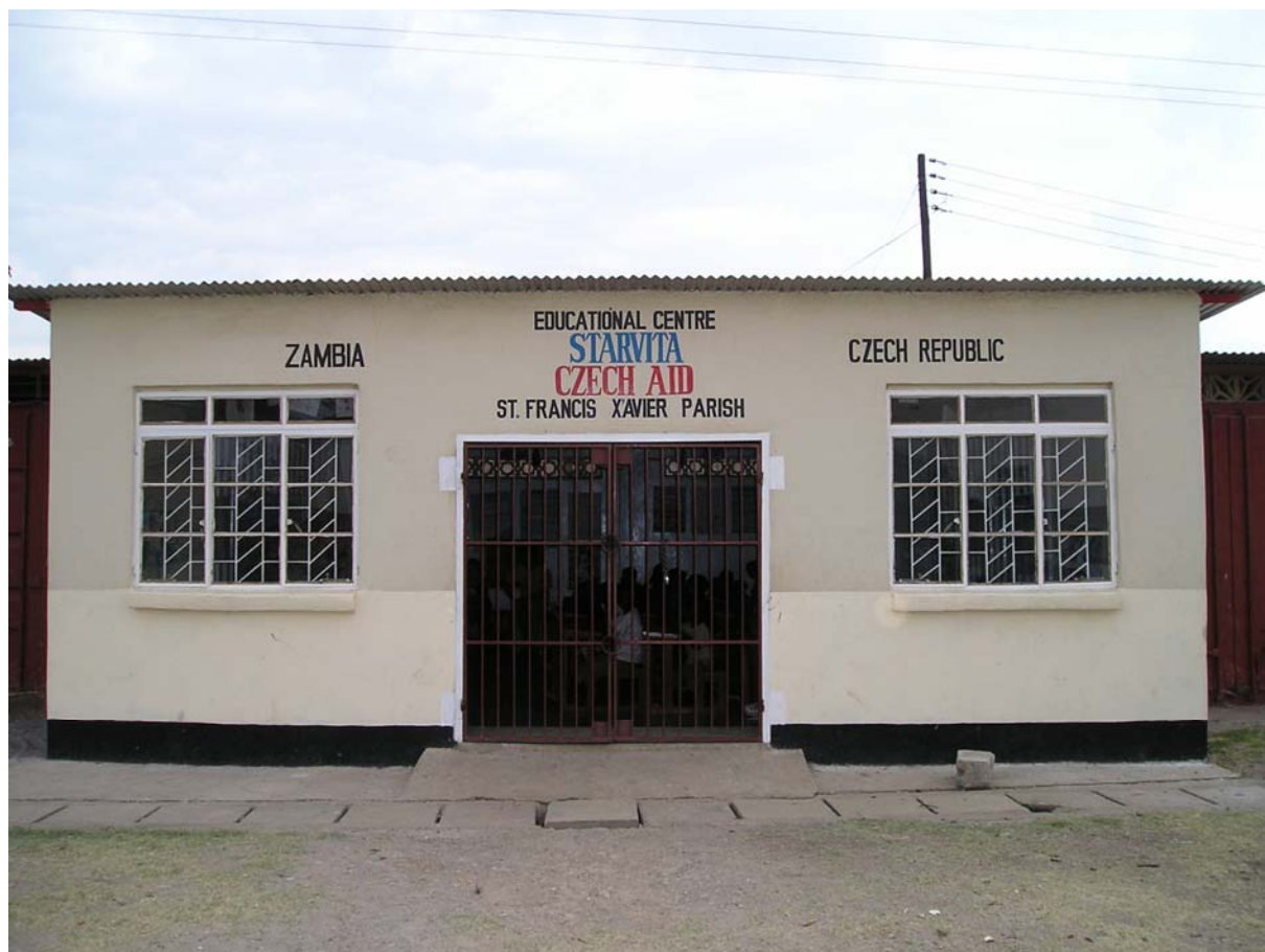
Edukační centrum v Kalingalinga