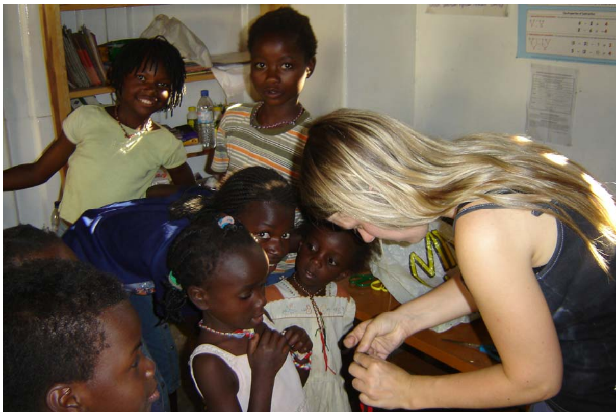
Odpolední program – pletení náramků