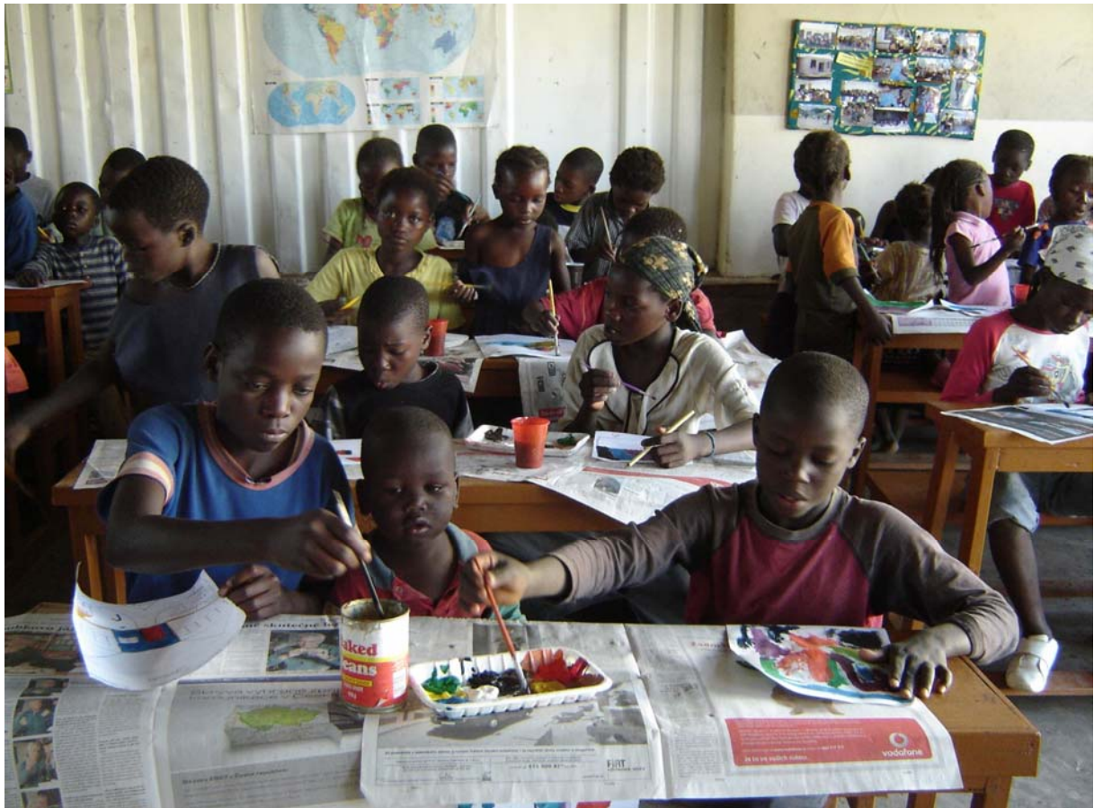
Odpolední program - malování