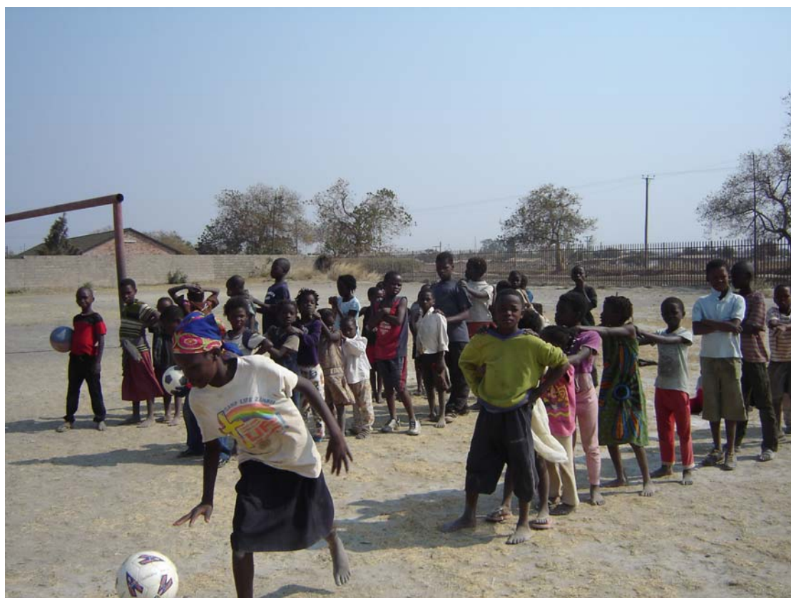
Páteční sportovní aktivity na hřišti