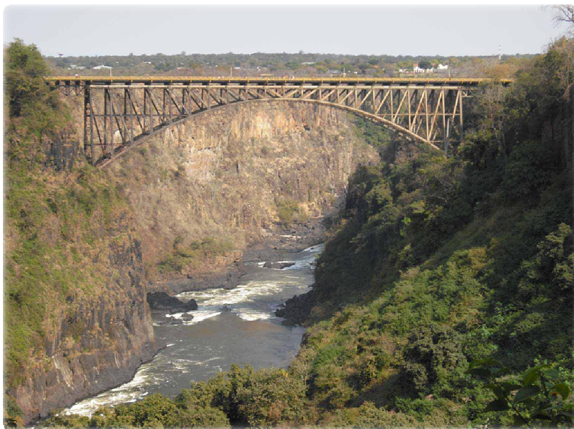
Mezi Zambíí a Zimbabwe

Most může symbolizovat spojení protikladů, být přechodem mezi dvěma obdobími nebo spojovat různé stránky v člověku - také se dá považovat za cestu... Díky němu je možné vidět věci z nadhledu, ale zároveň nahlédnout pod něj, kde může být něco, co nevidíme rádi. Tohle vše se mi promítlo během týdnů strávených v Zambii, zemi, kterou pořád nedokážu popsat jinak, než jako naprosto odlišnou. Ten pocit, ať už po přistání na opačné polokouli, při kontaktu s dětmi, co vás tak rády drží za ruce, nebo při pozorování a vnímání lidí, atmosféry, prostě toho, co vás bezprostředně obklopuje, asi nedokážu přesně sdělit – ale určitě stojí za to ho zažít. Jestli vás Afrika láká, sníte o ní, bez obav vykročte na most, který vás třeba dovede až za hranice vašich představ.