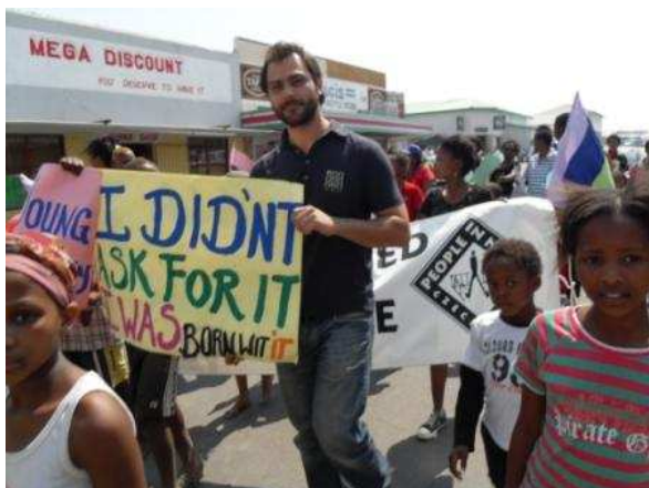
Pochod na podporu nového projektu PIN týkající se sexuálních minorit

matkám a jejich dětem opět se nějak potýkající s HIV/AIDS; podpora sirotků a dětí čelící chorobě HIV/AIDS; podpora Svépomocných skupin; poskytování malých grantů a mnohé další; 3) projekt na podporu lidských práv a svobod sexuálních minorit žijících v Namibii.