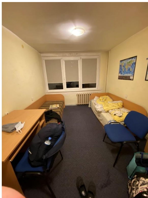
Pokoj na koleji číslo 1