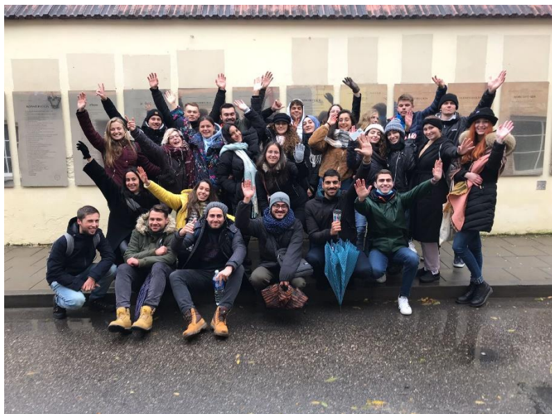
Naše skupina na výletě ve Vilnius, pořádané ESN