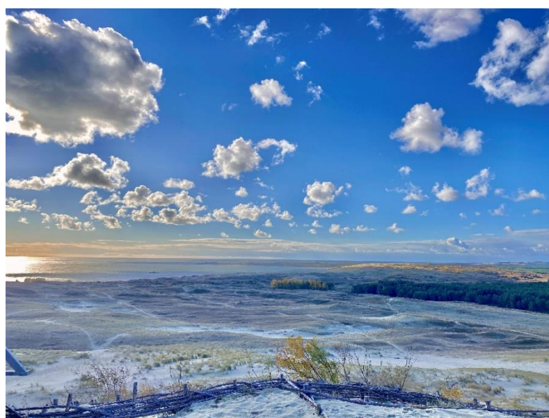
Jihozápadní část Litvy