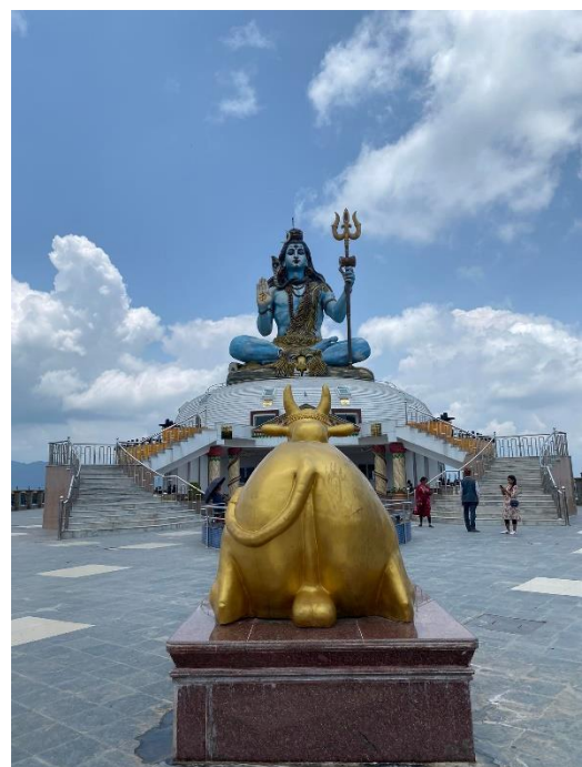
Lord Shiva, Pokhara